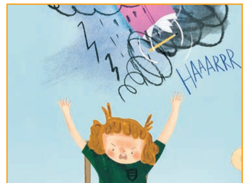
Quand quelqu'un fait une crise près de moi: