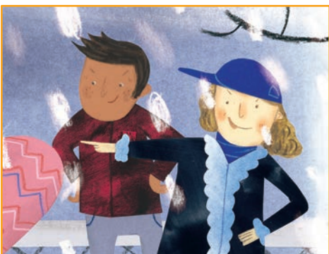
Quand les autres rient de moi: