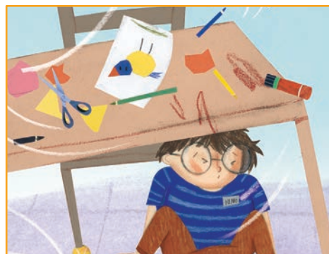
Quand je me cogne contre quelque chose: