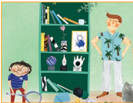
Quand je me fais chicaner: