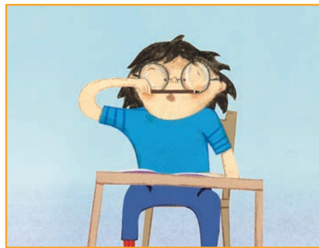
Quand je fais rire les autres: