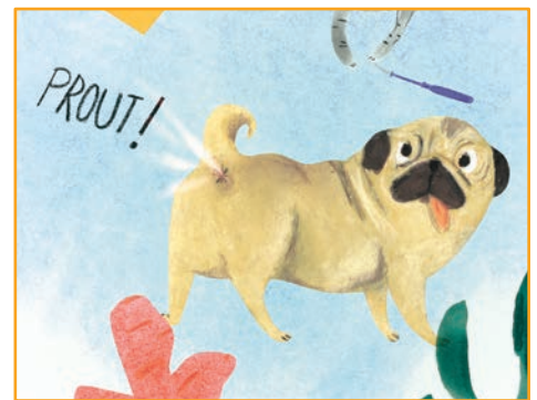
Quand mon animal pète: